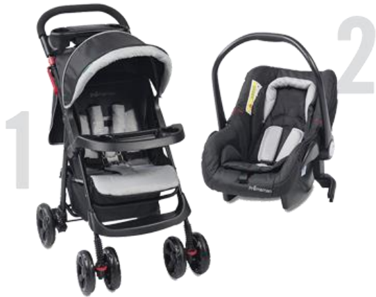
Duo : poussette + coque