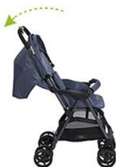
à partir de 6 mois : siège inclinable à 45° pour assoir bébé