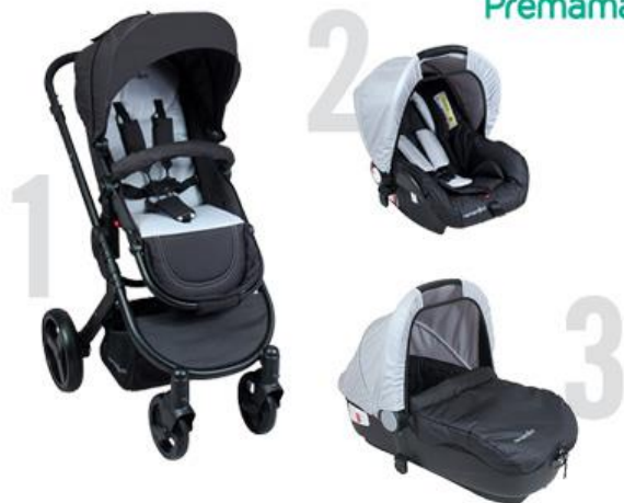
Trio : poussette + coque + nacelle pour un couchage adapté au transport