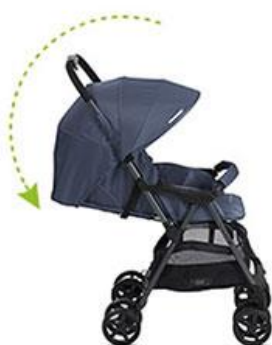
dès la naissance : siège à inclinaison maximale pour allonger bébé

Les premiers pas vers l'extérieur doivent aussi bien être pratiques et confort qu'esthétique, cependant cela doit également correspondre à votre style de vie. La poussette a tant un côté design que pratique, c'est pourquoi il ne faut pas privilégier l'un des deux. Grâce à notre large gamme de produits, nous avons la possibilité de lier ces deux facteurs afin de vous offrir la parfaite poussette.